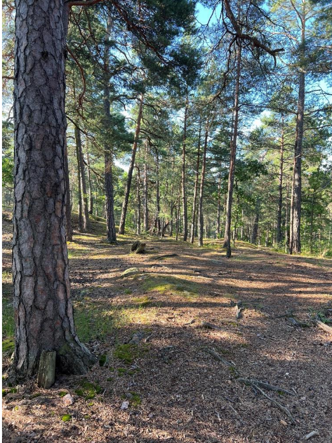
Figur 2. I Hemskogen finns många gamla tallar.